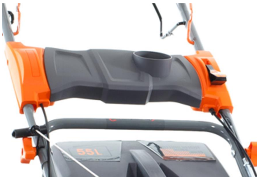
Suport pahar, creat special pentru a spori confortul utilizatorului.