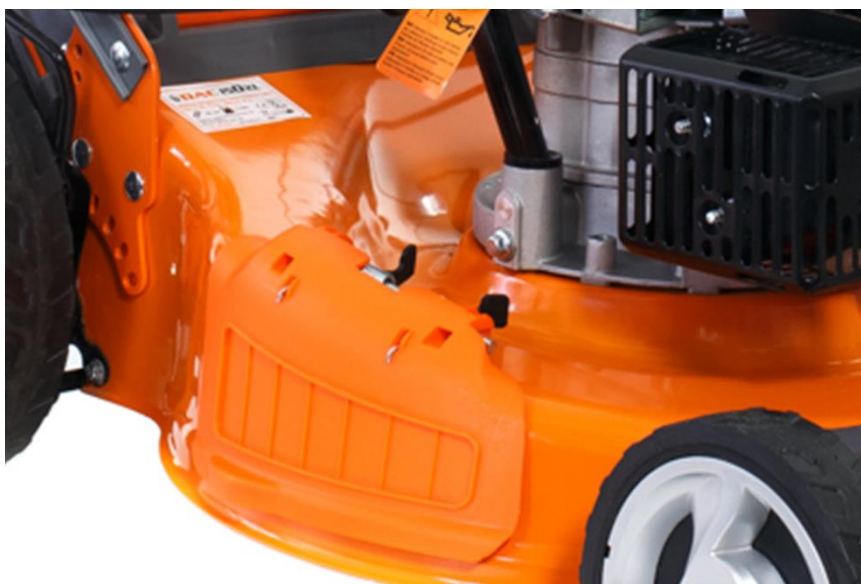
Funcție evacuare laterală.